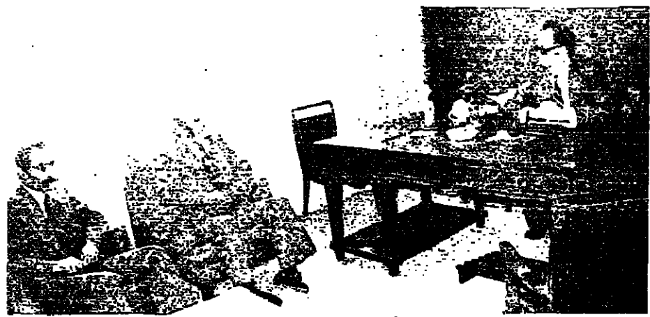
السبعلاهي وعلمس في معاينة الرئيس الحكومة

شؤون الدولة ملاحظات ٢ - تدنا له مذكرة تتضمن الملاحظات التي على بنود المشروع : ١٩٧٥-١٩٧٦ ، خاصة بالنسبة للدارس التي استأثرت العمل هذا العام .